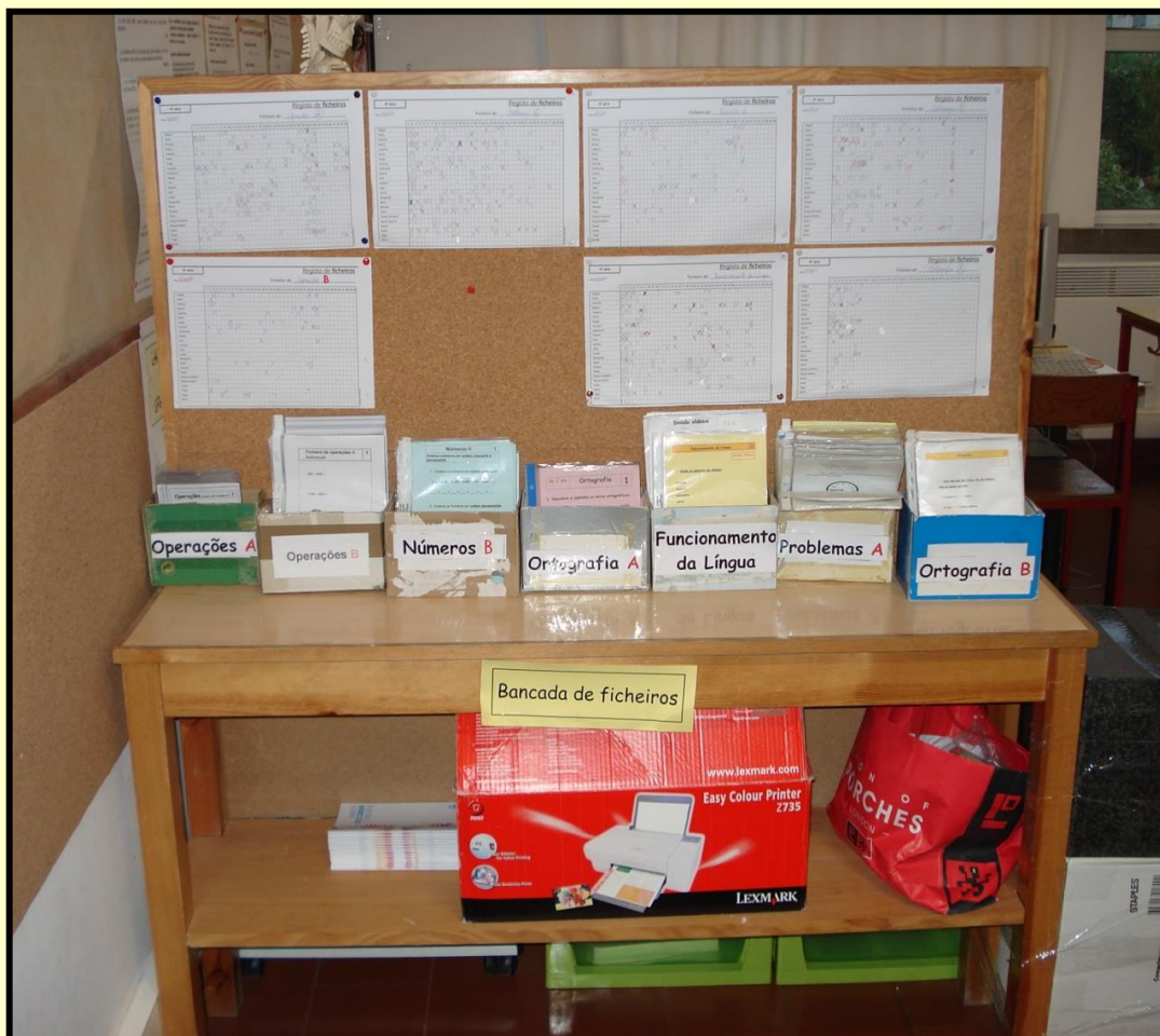
Bancada de ficheiros

Gestão cooperada do espaço, materiais e atividades curriculares em Conselho de Cooperação Educativa